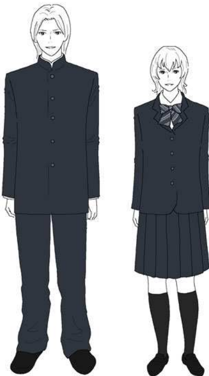
(滋賀短期大学付属高校)